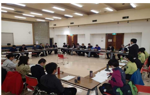
第1回平成30年11月27日 大雪山国立公園ビジョン【骨子案】