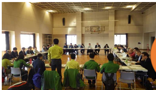
第2回 平成31年2月20日 大雪山国立公園ビジョン【素案】

大雪山国立公園ビジョン を先行的に議論 協働型管理運営体制構築 に向けた機運を醸成